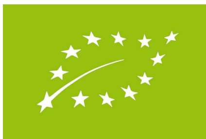
Έγχρωμος Λογότυπος βιολογικής παραγωγής της ΕΕ

Η χρήση του κοινοτικού λογότυπου είναι υποχρεωτική από 01/07/2010 σύμφωνα με τον Καν. (ΕΕ) 271/2010 για την επισήμανση και διαφήμιση προϊόντων που έχουν πιστοποιηθεί ως προς αυτόν. Επιτρέπεται να συνεχιστεί η διάθεση στην αγορά αποθεμάτων προϊόντων που έχουν παραχθεί, συσκευαστεί και σημανθεί πριν από την 1η Ιουλίου 2010, σύμφωνα με τον κανονισμό (ΕΟΚ) αριθ. 2092/91 ή τον κανονισμό (ΕΚ) αριθ. 834/2007, με ενδείξεις που αναφέρονται στη μέθοδο βιολογικής παραγωγής μέχρι την εξάντληση των αποθεμάτων. Το χρώμα αναφοράς Pantone είναι πράσινο Pantone αριθ. 376 και πράσινο [50 % κυανούν + 100 % κίτρινο] όταν χρησιμοποιείται τετραχρωμία.