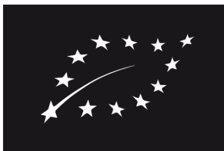
Ασπρόμαυρος Λογότυπος βιολογικής παραγωγής της ΕΕ

Ο λογότυπος βιολογικής παραγωγής της ΕΕ δύναται να χρησιμοποιείται σε ασπρόμαυρο μόνον όταν δεν είναι δυνατόν να χρησιμοποιείται έγχρωμος, ως εξής: